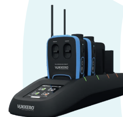
Chargeur & Configurateur

Chargeur & Configurateur avec écran tactile pour configuration intuitive