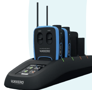
Chargeur & Configurateur