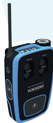
VOKKERO® GUARDIAN ATEX