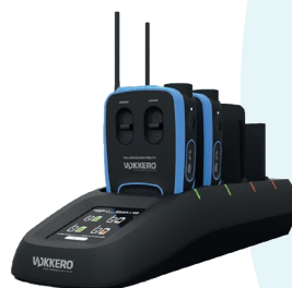
Chargeur & Configurateur tactile

CHARGEUR > Chargeur & Configurateur avec écran tactile pour configuration intuitive